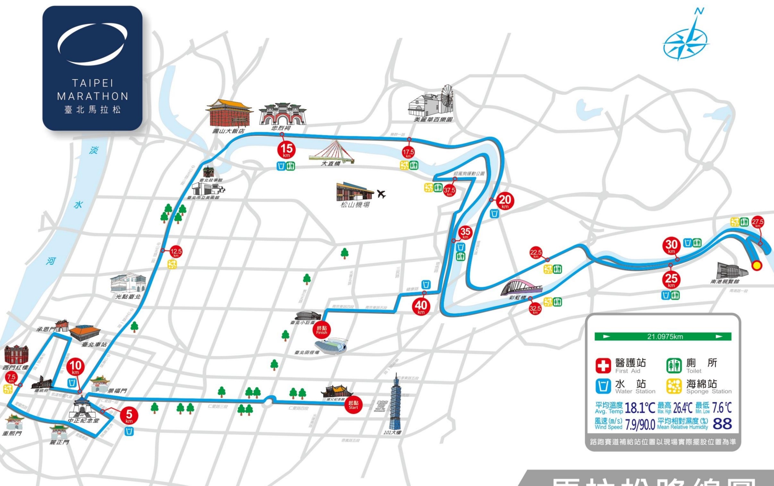
Marathon Route Map 馬拉松路線圖